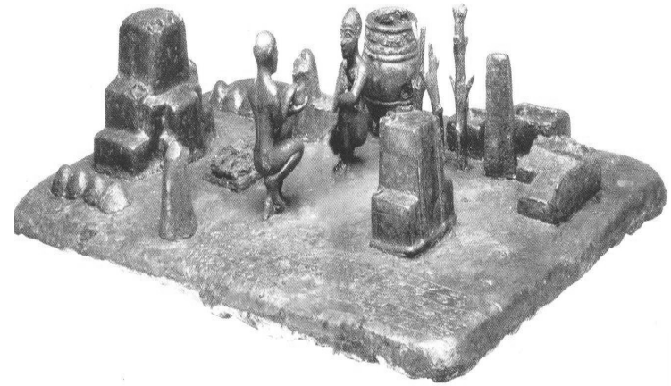
رۆژهه‌لاتن له شوش، سه‌ده‌ی دوازده‌می پ.ز. ، مۆزه‌خانه‌ی لوور، پاریس