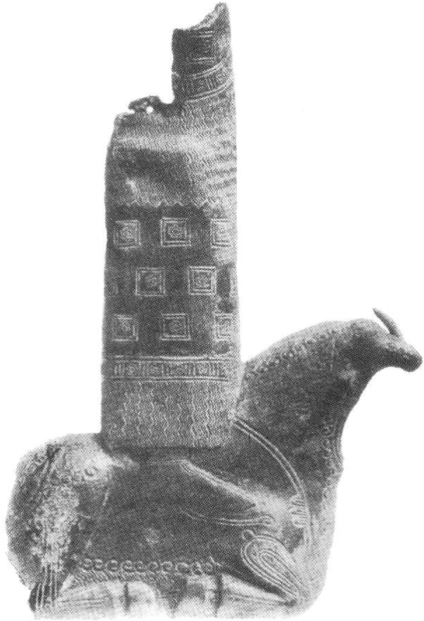
ئۆرارتووه كان Uartians

په يکەريکی مەفرەغى بچوک، لەوانەيه خواوەندی تيشی شاب teishab بيت و پاشاوەی تەختیکی مەفرەغیيه که ئیستا لەناوچووه. تۆپراق قەلا سەدەى هەشتەم – هەوتەمى پ.ز