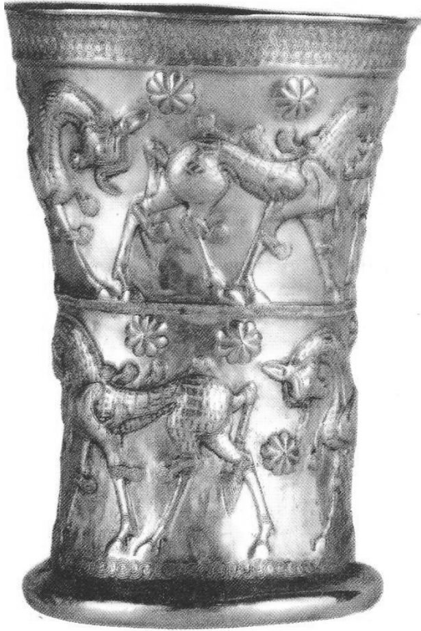
ئاریاییه کان Aryans

جامیکی له ئالتون دروستکراو که کۆمه له گیانداریکی له سهر نه خشینراوه له مارلیک ۱۴۰۰ - ۱۰۰۰ ی پ. ز دۆزراوه ته وه. مۆزه خانه ی میلی ئیران، تاران