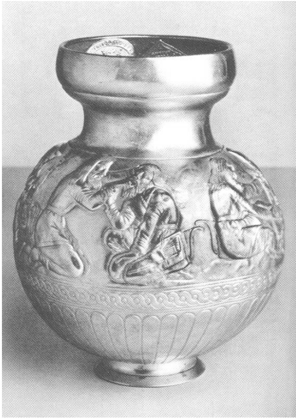
گۆزه‌یه‌کی نیلیکتۆرم له کول - ئۆبا kul-oba