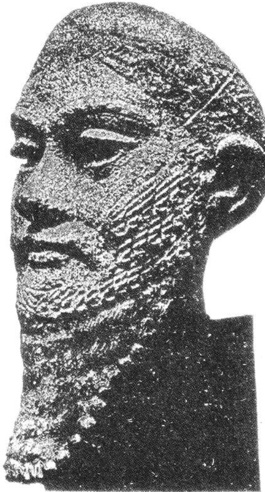
پهیکه‌ری له مه‌فره‌غ دروستکراوی تاییه‌ت به فه‌رمانه‌وای گوتییه‌کان. کۆتایی هه‌زاره‌ی سینییه‌می پ.ز.