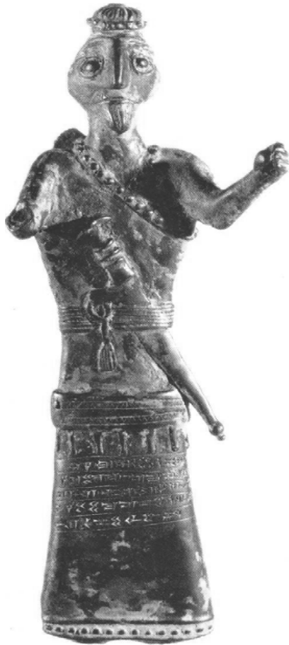
کیمییرییه کان Cimmerians

پدیکه ریکی سه رنجرا کیشی له مه فرده د روستکراو، شمشیر و تیردان و نووسراوه بهردینیکی سی د پیره خه تییه. له لۆرستان دۆزراوه ته وه. هونه ری کیمییرییه کان مۆزه خانه ی میلی ئیران، تاران.