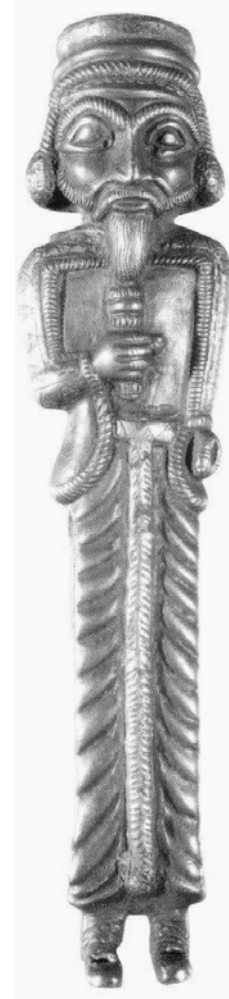
مانناییه کان Mannaeans

پهیکه ری له زیو دروستکراوی شازاده یان فرمانره وای، له کۆلیکسیونی جه یحون هونه ری ماننایی — مۆزه خانه ی بهریتانیا