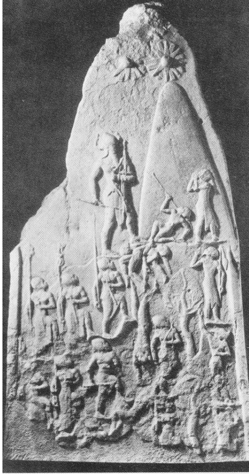
لوولووه كان Lullubians

دیمه نی سهرکه وتنی نارام — سین فرمانره وای شه کهد به سهر چیا یهک نه خشینراوه، له کاتی سهرکه وتن به سهر لوولووییه کان، له سهر ستونیککی بیرئانیین له شوش