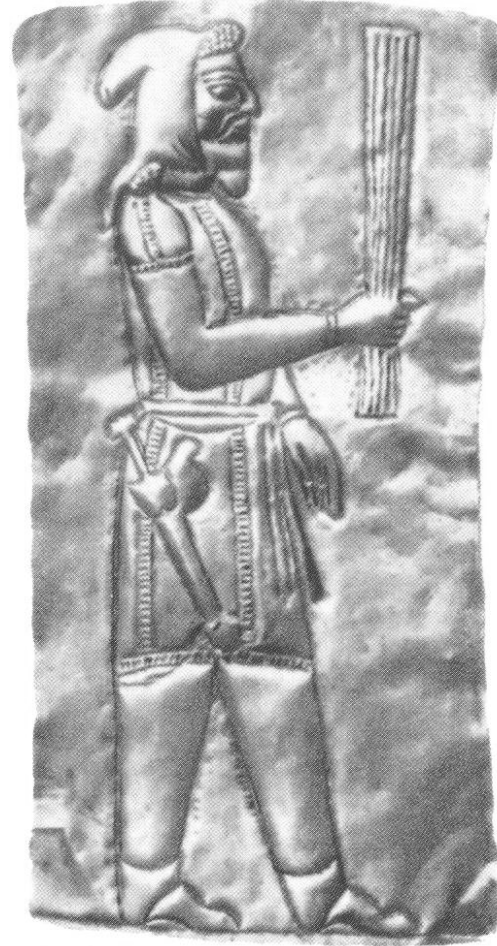
ماساژیتته کان Massagetae

وینه یه که له کۆلیتکسیونی جه یحون که شیوه و جلوه برگی ماساژیتتییه کی پیشانداوه.