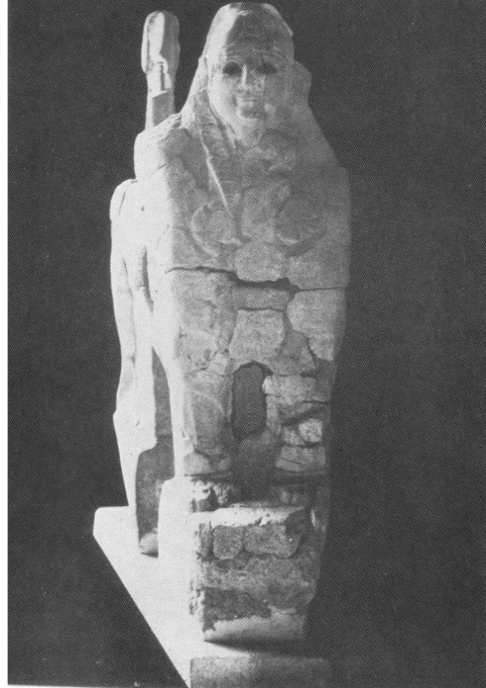
ئەبولهولى هيتيايى Hittites

ئەبولهولى هيتيايى لە دەروازەى ييرقاپو yerkapu لە بۆغازکوى