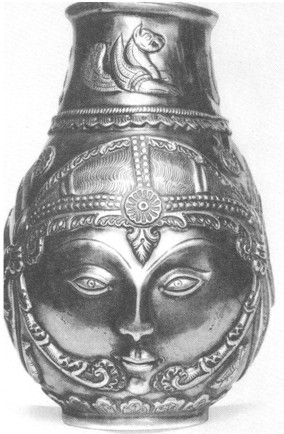
جامیکی له زیو دروستکراوی سیمای ژنیک له روژگاری ساسانییه کان