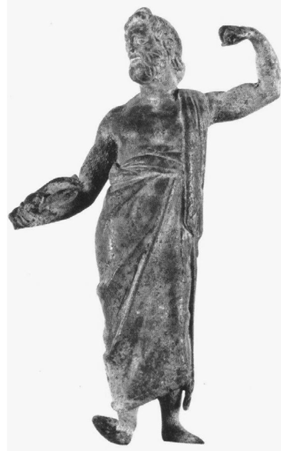
پهیکه‌ری له مه‌فره‌غ دروستکراوی شامی shami یان زیوس zeus یان پوسیدون Poseidon، جلویه‌رگه‌که‌ی کاریگه‌ری کولتوری یونانی پیشانده‌دات. ده‌ورویه‌ری ۱۰۰۰ - ۲۰۰ ی.پ. له نه‌هاوه‌ند دۆزراوه‌ته‌وه. مؤزه‌خانه‌ی میللی شیران، تاران