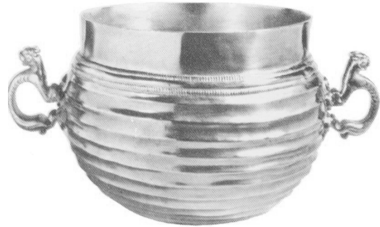
سارماته کان Sarmatians

جامیکی له ئالتون دروستکراو که دهسکه کانی له سه ر شیوه ی جوړه گیانله بهر نیک د روستکراوه