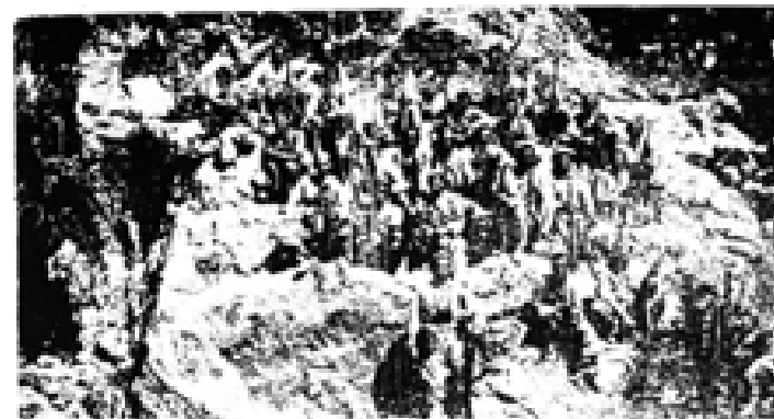
هه‌یاس مامه‌ت ئافا، په‌کێک له‌ گه‌وره سه‌رگه‌ده‌کاشی بارزانی، شو مووریشتگی به‌ده‌سته‌وه‌په و له‌به‌رده‌م سه‌ریازی هه‌هۆزی (تاکو) وه‌ستاره که گه‌وره‌ترین هۆزه له‌ پۆله‌لانی کوردستان