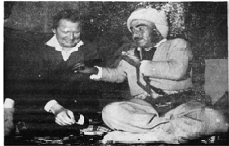
ژەنیال بارزانی بۆ پەیمانگیر (شمبەت) دەدوێ