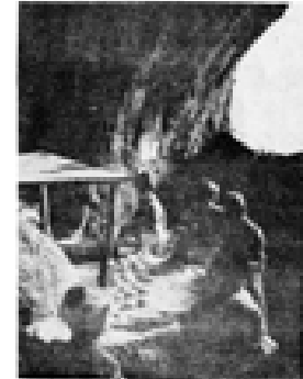
خۇيان ئانىيان بۇخۇيان دروست دەركورد.