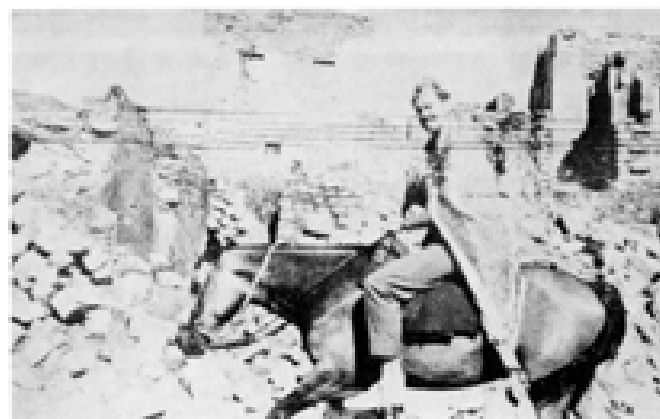
پەیمانێڤر (( شەیدەت )) بە ئاوجەپەکی بۆردومانکراوەدا پێدەپەڕن