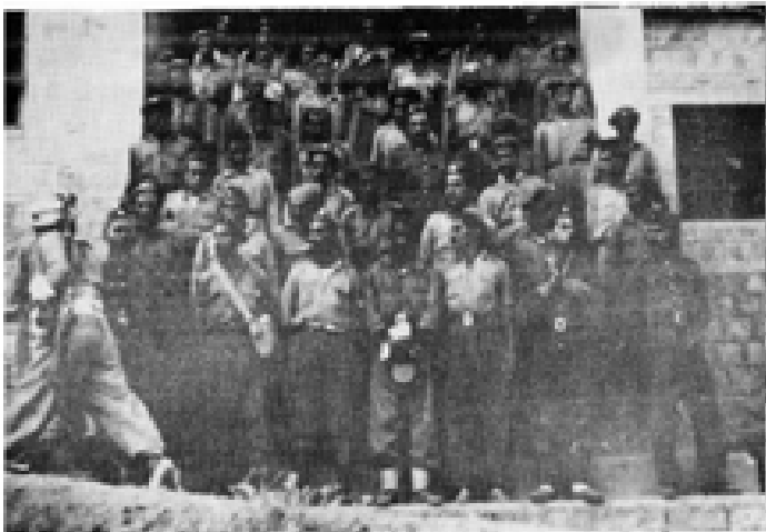
دپله کانی عراق که له لایهن هینه کانی بازارانییهوه به دیل گیراون