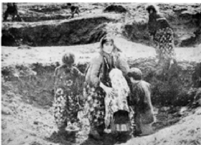
گوندی (سەرگەپکان) کە خۆزگەکان بۆردومانان کرەووە، لەوێن هێندێک منداڵی کۆرە دیارن خۆیان لە کامیڤا پەتا دەدەن