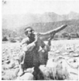
شۆرشگېرىكە لەسەر ئېلېزىرى زىن تاقو لە كالبازىكە دا دەخواتىرە.