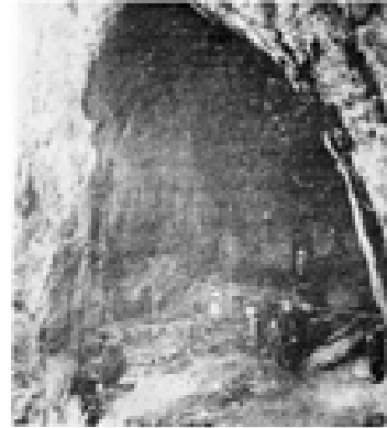
لە هەندىن ناوچەدا شووتى نىشتەجىبووتى كوردەكان تەنها بىرىنى بىو لە ئەشكەوتەكان، كە شۆرشگېران بارەكانىيان تىادا دانا بىو.