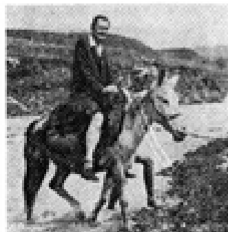
شعبهت لهگه‌ل (نه حمهه شوپه‌قانی پزیره‌یدا له پوربارنگی بچووک ده‌په‌پشته‌وه.