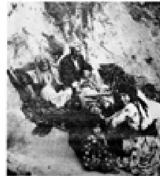
لە كاتىنگا غىزانە ئاوارەكان گوندە بۆردەمانگراوەكانىيان جىندەھىتىن پەتا بۇ حەشارگە شاخاوبىيەكان دەپەن.