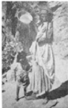
تافره‌نژکی تاوره له شپۆی گەلی گەنم به بەیا دەکا