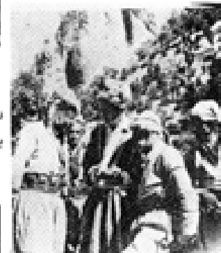
دانه‌ر و ئه‌ستره‌نگه‌ی به‌به‌رده‌وانی بۆک ته‌ده‌گه‌پتن و ناوی ئه‌ستره‌نگه‌ی ناچوو گه‌سه‌له بچووک.