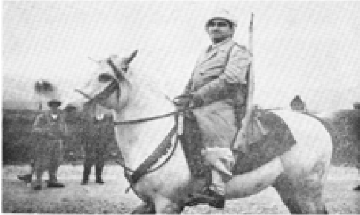
ژەنېرال مستەفا بارزانی، قەلانیڭ بەجێدەهێنان و بەردەو بارەگایەکی نوێ دەچێن