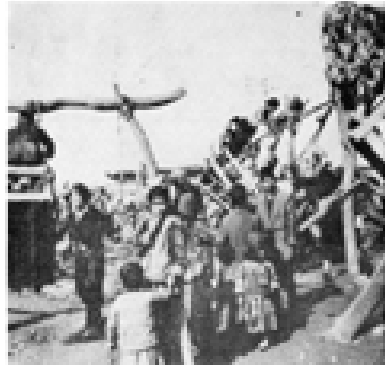
منداڵانی گورد له جل و بەرگی جێژندا، بازاری له لاندین